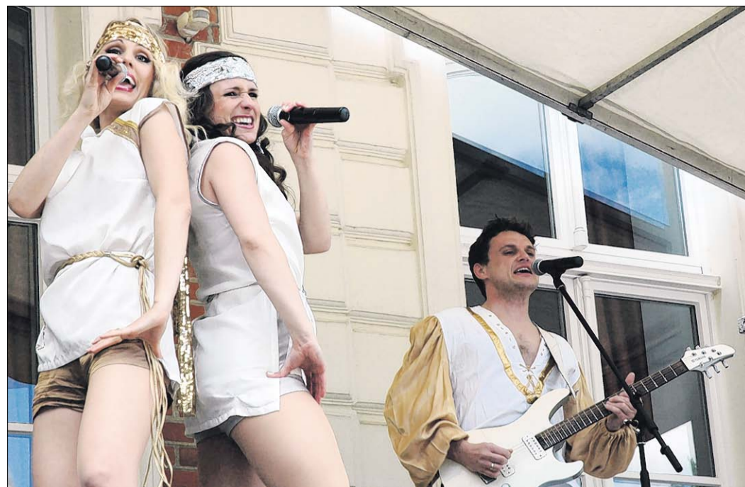
Mit „Mamma Mia“ startete die Band „Two 4 fun“ ihre ABBA-Show, die das Publikum zum Mitsingen und zum Tanzen animierte.

Maibowle auf Schloss Calberwisch lockte gestern zahlreiche Besucher an