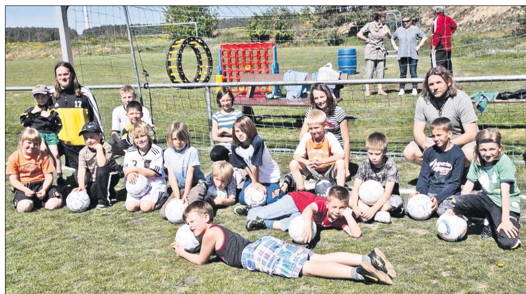
Das Schnuppertraining stand alle Kindern und Jugendlichen offen.

Den Tag beschloss ein Tanzabend in den Mai.