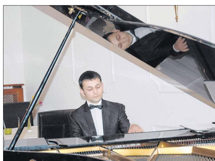
Pianist Rustam Abdullaev unterhielt sein Publikum auf Schloss Calberwisch mit klassischer Musik.

Behrendorf (vl). Verletzungen zog sich ein 51-jähriger Motorrollerfahrer in Behrendorf zu, als er am Freitag gegen 15.50 Uhr nach einer Kollision mit einem Fiat stürzte. Als der 34-jährige Autofahrer den Roller überholen wollte, fuhr der 51-Jährige auf die linke Fahrbahnseite, so die Polizei.